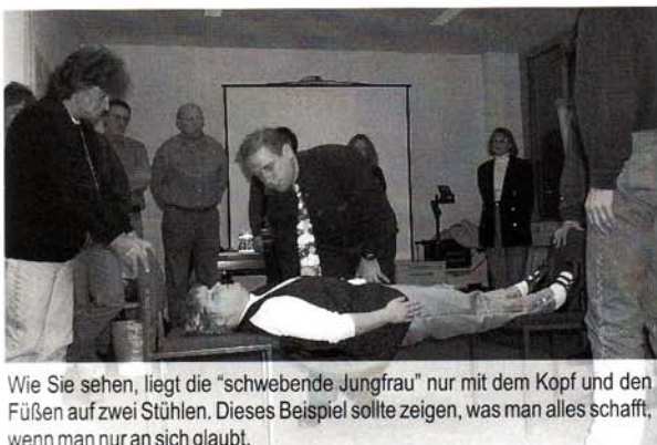
Wie Sie sehen, liegt die "schwebende Jungfrau" nur mit dem Kopf und den Füßen auf zwei Stühlen. Dieses Beispiel sollte zeigen, was man alles schafft, wenn man nur an sich glaubt.

Der durch Rundfunk und Fernsehen bekannte Hypno-