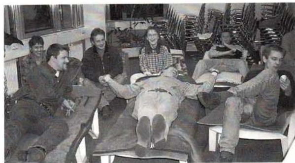
Es herrschte ein lockere Stimmung, wie man deutlich auf diesem Bild erkennen kann. Fast der gesamte Personaleinsatz der Abt 31 hat an diesem Seminar teilgenommen.

tiseur hat ein überzeugendes Konzept entwickelt, das deshalb so erfolgreich ist, weil es die Hypnose mit der indi-